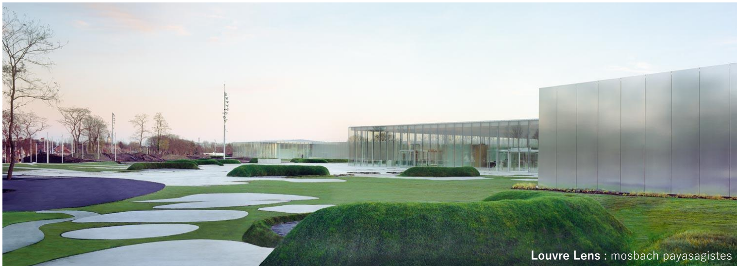
Louvre Lens : mosbach paysagistes

2023- 工学院大学 建築学部まちづくり学科准教授 2020- 多摩美術大学 環境デザイン学科非常勤講師 2017- 戸村英子設計事務所 設立 2012-2017 石上純也建築設計事務所 勤務 2007-2012 Mosbach paysagistes, Paris France 勤務 2007 WRT Wallace Roberts and Todd, PA USA 勤務 2007 University of Pennsylvania Master of Landscape Architecture, PA USA 修了 2002 工学院大学工学部 都市建築デザイン学科 卒業