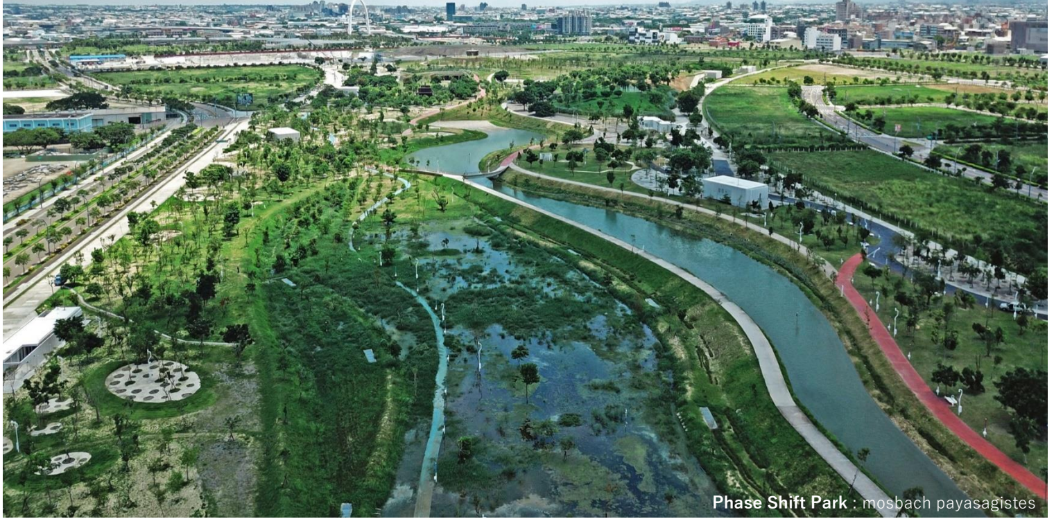
Phase Shift Park : mosbach payasagistes