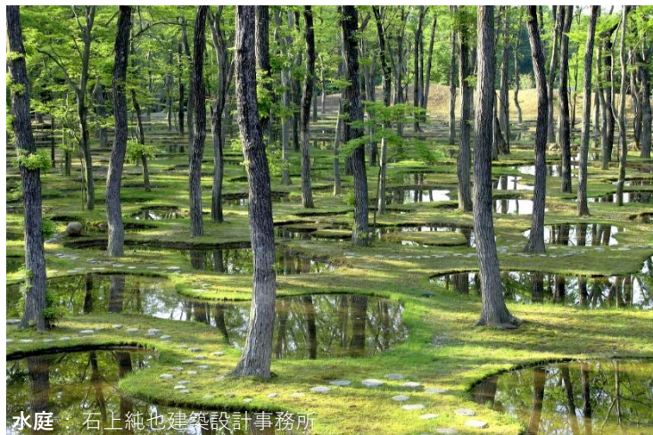
水庭 : 石上純也建築設計事務所

お問合せ 茨城県建築士会県央支部(平日9:00-15:00) 水戸市中央1-4-1 水戸市役所建築指導課内 TEL 029-224-1111 携帯 080-4959-8339