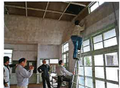
旧初原小学校講堂 調査風景