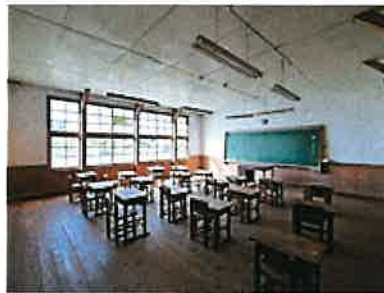
大子町 旧初原小学校教室内