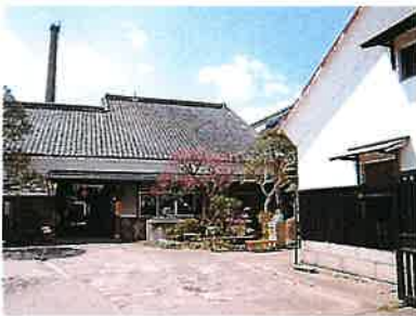
桜川市真壁町 村井醸造 震災前