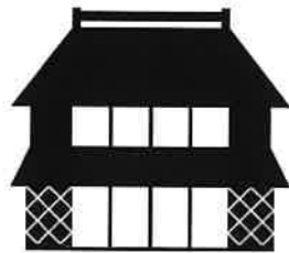
ヘリマネいばらき

主催 一般社団法人 茨城県建築士会 共催 茨城県教育庁文化課 後援 茨城県土木部都市局都市計画課