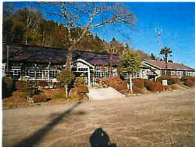
大子町 旧上岡小学校