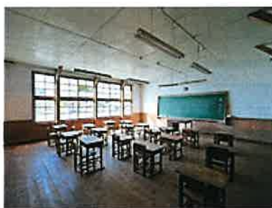
大子町 旧初原小学校教室内