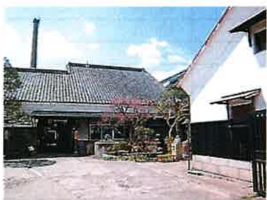
桜川市真壁町 村井醸造 震災前