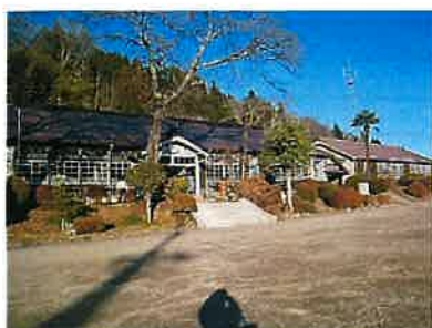
大子町 旧上岡小学校