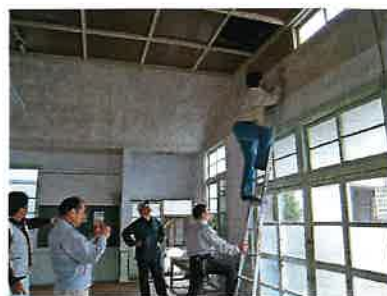
旧初原小学校講堂 調査風景