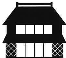
ヘリマネいばらき

主催 一般社団法人 茨城県建築士会 共催 茨城県教育庁文化課 後援 茨城県土木部都市局都市計画課