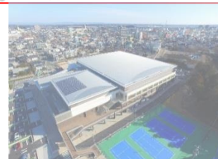
参考:東町運動公園 HP マップ