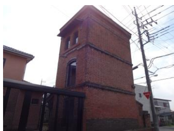
常総：五木宗レンガ蔵

※この体感ツアーをもとに、第6弾 体感ルート・ガイドマップを作成し、土会の活動を、会員・行政及び一般市民の方々へ広報したいと考えております。